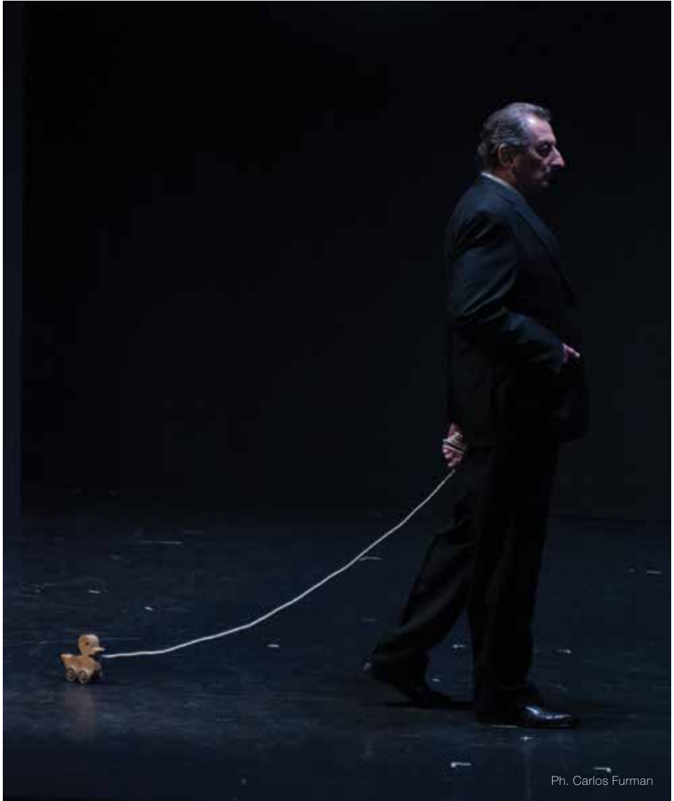
Ph. Carlos Furman