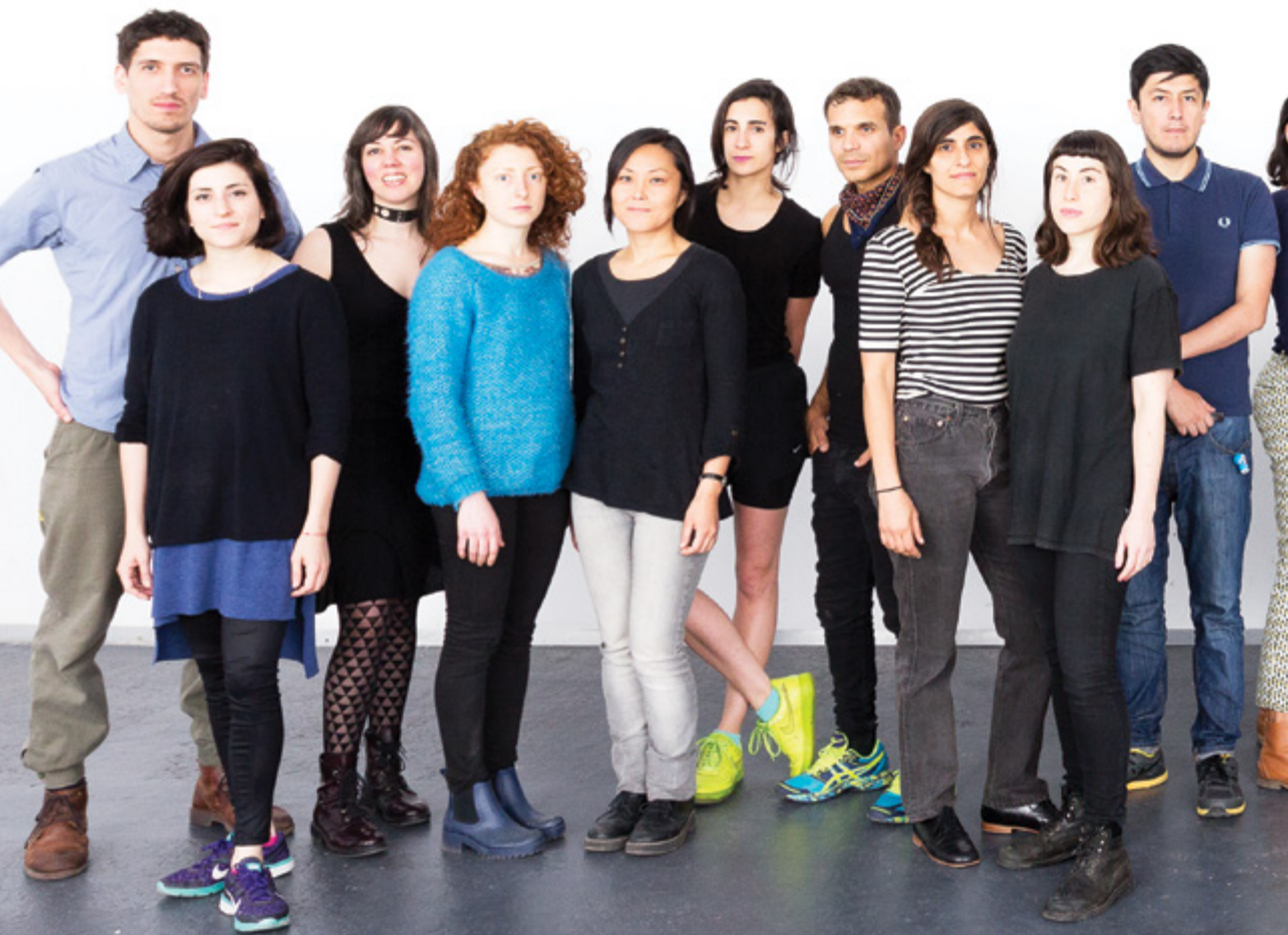
Participantes artistas y curadores del Programa de Artistas 2015