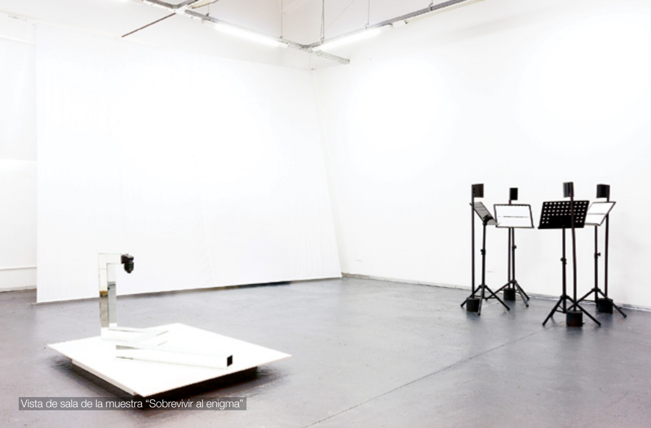
Vista de sala de la muestra "Sobrevivir al enigma"