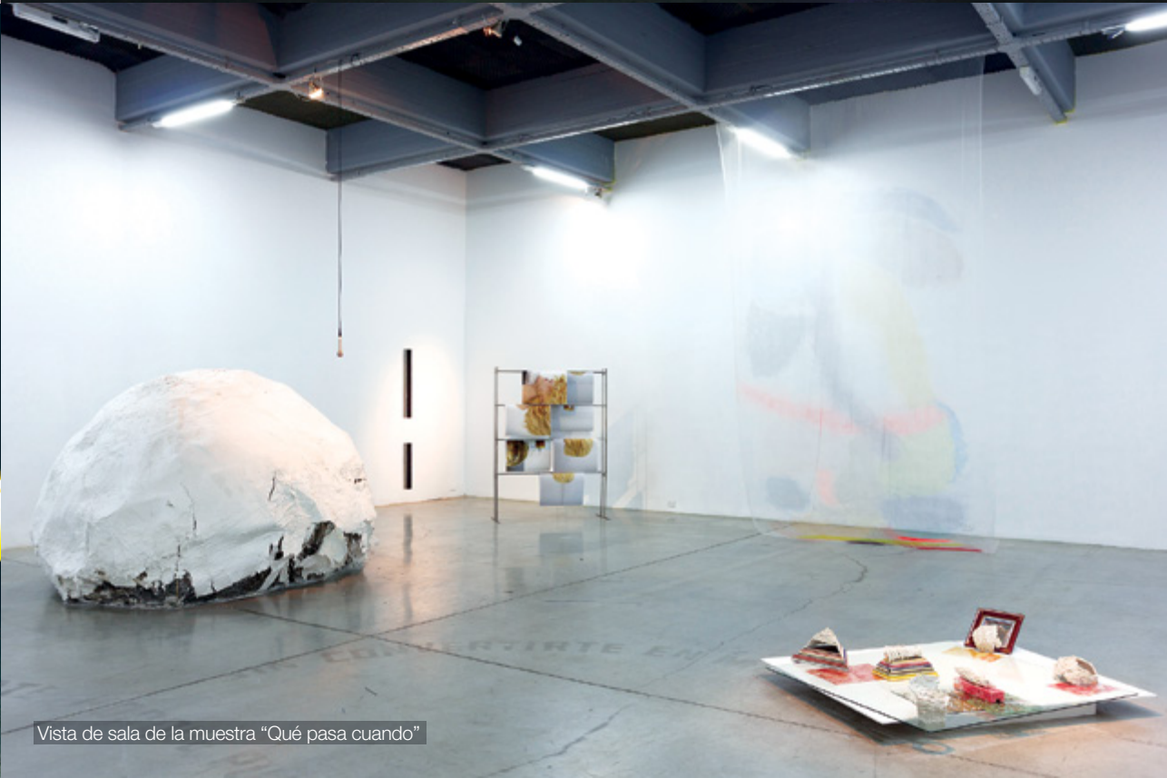
Vista de sala de la muestra "Qué pasa cuando"