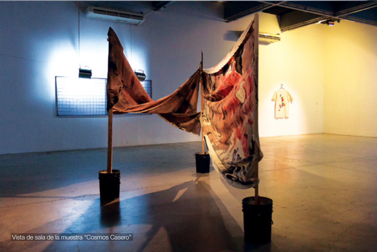
Vista de sala de la muestra "Cosmos Casero"