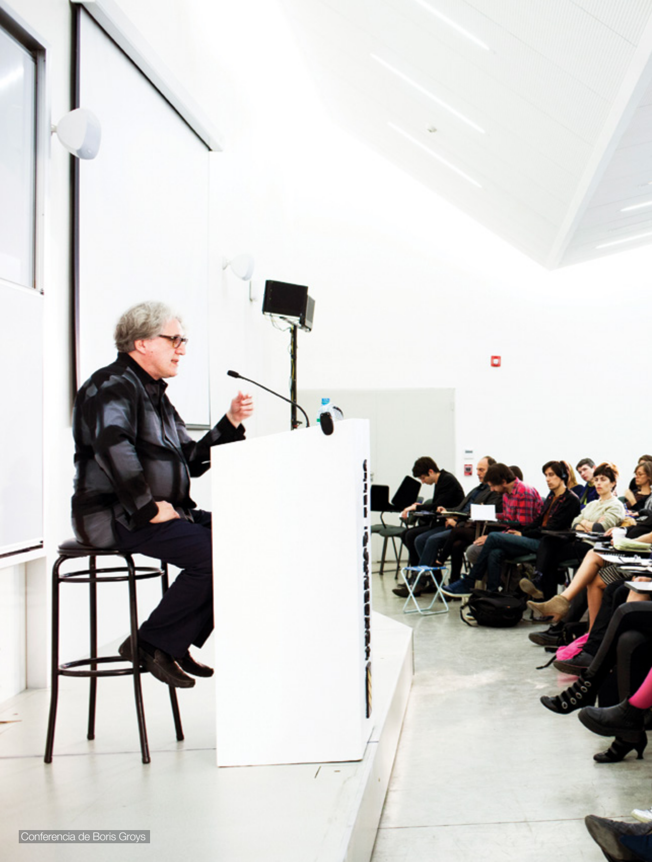
Conferencia de Boris Groys