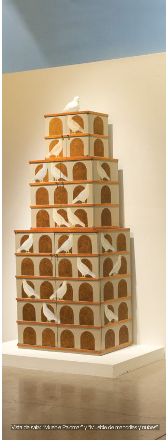
Vista de sala: "Mueble Palomar" y "Mueble de mandriles y nubes"

Edgardo Giménez es uno de los referentes más destacados del arte y el diseño pop argentinos, y uno de los artistas más paradigmáticos del Instituto Torcuato Di Tella, donde realizó varias de sus obras más reconocidas y donde entabló relación con Jorge Romero Brest, con quien realizaría diversos proyectos arquitectónicos y comerciales. Con un lenguaje único, su obra incluye diseño gráfico, diseño industrial, arquitectura, pintura y escenografía.